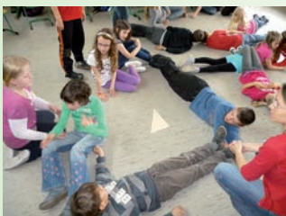
LTTA: Rechter Winkel