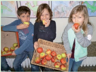
Schulfruchtprogramm: Immer frische Äpfel