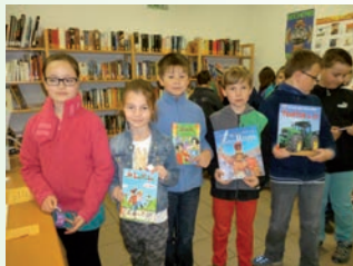
Regelmäßige Besuche in der öffentlichen Bücherei